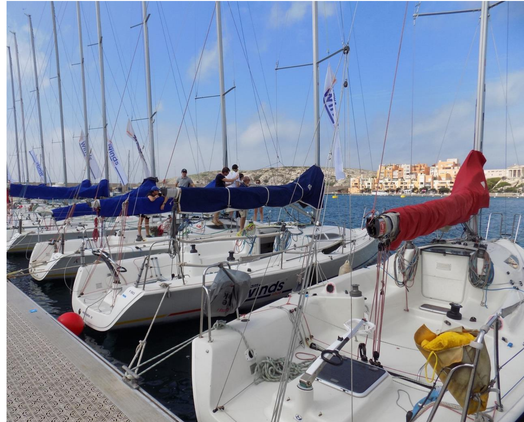
Notre flotte monotype de 18 Grand Surprise

Son large réseau d'entraîneurs et de coachs diplômés garantit un savoir-faire unique en France. La connaissance du plan d'eau de Marseille, théâtre des JO de voile, vient renforcer encore l'intérêt pour toutes celles et ceux qui souhaitent se perfectionner, en mode sport et bonne ambiance !